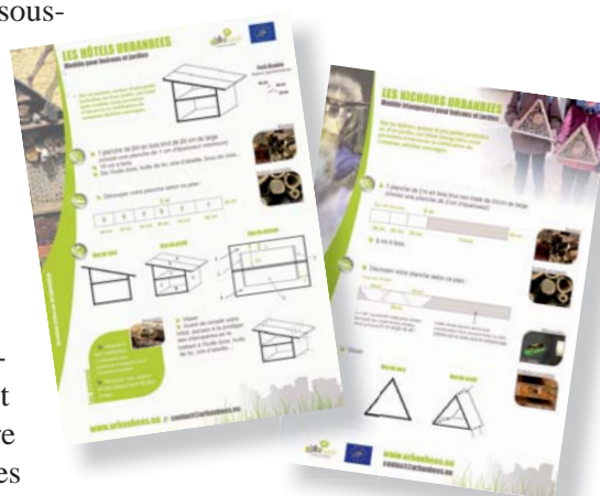
Différents modèles de nichoirs faciles à réaliser sont disponibles sur le site.

tion des professionnels et un guide des bonnes pratiques à destination des collectivités et des habitants 2 .